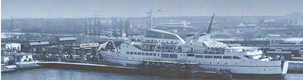
Prom Skandynawia w Świnoujściu.

Już w rok po inauguracji linii do Ystad zakupiono drugi prom, któremu nadano nazwę Skandynawia . Na 1969 r. zaplanowano uruchomienie drugiej linii promowej, z Gdańska do Helsinek. W dalszych planach były połączenia z Oslo, Kopenhagą i Londynem.